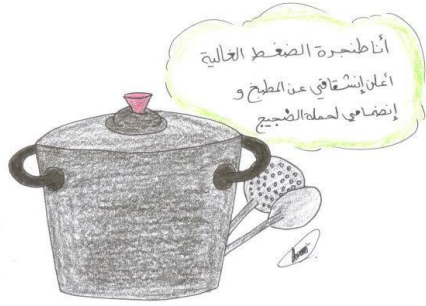
كاريكاتور حرة من بابا عمرو