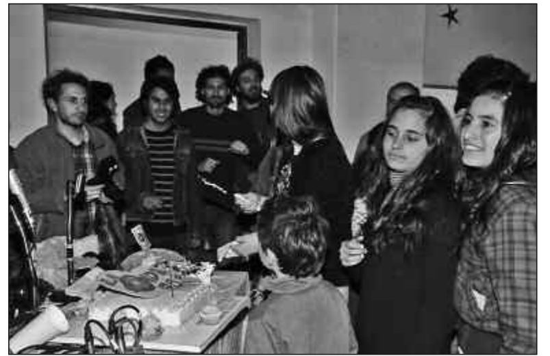
El sábado 27 hubo fiesta con torta y todo por el primer aniversario.

De un año para el otro, La Ronda pudo concretar algunos pequeños grandes logros que enumeraron a propósito del festejo del primer aniversario: