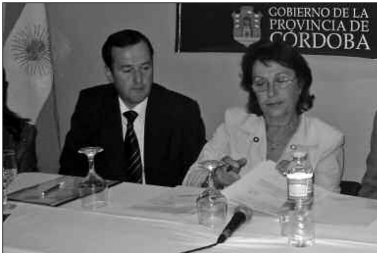
El Consejo Local de Niñez impulsará la apertura de una UDER propia

Hay UDER en Cosquín, Bell Ville, Laboulaye, La Carlota, Villa Dolores, Deán Funes, Villa Nueva, San Francisco, Cruz del Eje, Alta Gracia, y Río Segundo. No se entiende por qué Jesús María no está entre las locali-