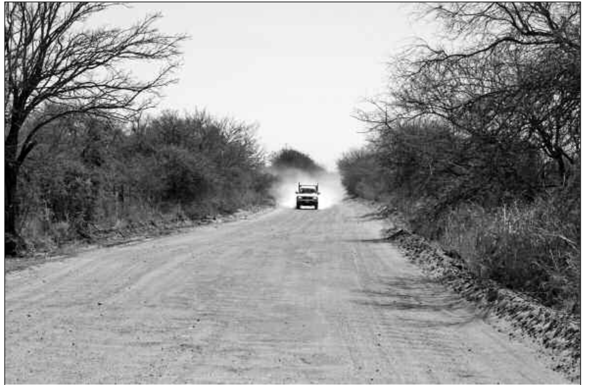
Arena, serruchos, banquetas no consolidadas, malezas sobre el camino y la lista de problemas sigue...

Otra vecina invitó al gobernador Schiaretti a que visite el lugar para que pueda ver con sus