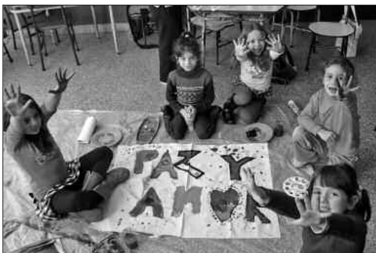
Cinco de cada diez chicos no tienen actividades físicas ni artísticas.

"Una noche me encontré con un grupo de cinco chicos que vivían en situación de calle en Plaza Italia. Me acerqué a uno de ellos, de no más de 11 años y le pregunté que necesitaba, él me contestó: yo necesito un lugar para expresar lo que siento", relata Gastón Pauls. Así, en 2004, el actor creó la Asociación Civil La Casa de la Cultura de la Calle (CCC). Allí, más de 350 chicos en situación de riesgo (de hogares, institutos o en situación de calle) encuentran un espacio de expresión a través de talleres de música, teatro, plástica y literatura recorran la palabra y juegan con la