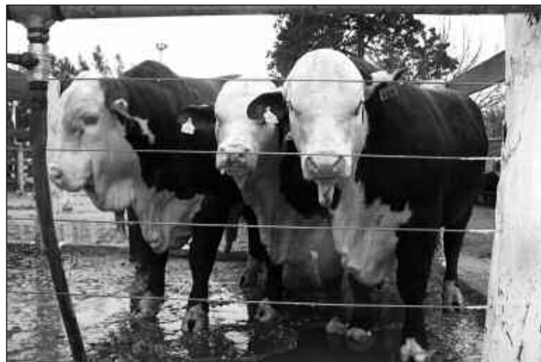
La ganadería tendrá un espacio destacado entre las actividades.

Toros inmunizados altamente calificados, vaquillonas seleccionadas y la expectativa por