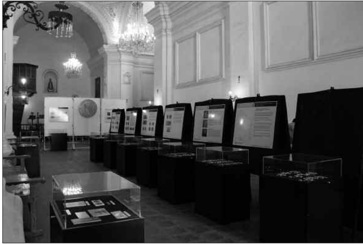
En la iglesia de la Estancia Jesuítica se montó la muestra numismática itinerante del Banco Central.

¿Qué podrán ver los visitantes? "Básicamente se pueden visitar en una misma exposición dos temáticas. Una es la historia de la moneda del siglo 16 hasta la actualidad y que es bastante entretenido porque en general a los visitantes les pasa que van recordando las épocas de su vida a medida que van viendo los distintos tipos de moneda