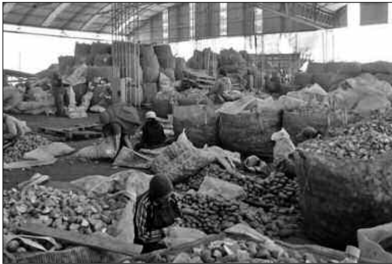
Detectaron trabajo esclavo en Colonia Tirolesa en un campo de papa.

Según el informe del organismo, los peones estaban alojados en casillas de 2,20 por 1,50 metros, sin aislante térmico ni contra insectos, no tenían permitido abandonar el predio hasta que terminaran el trabajo. Los delitos que se le imputan a la multinacional Pioneer prevén penas de prisión de 2 a 6 años. Sin embargo, los peones no es-