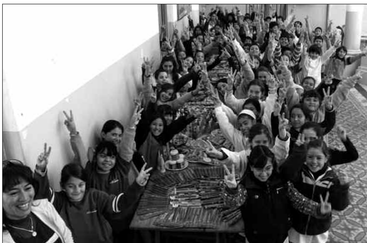
Alumnos de cuarto grado aprendieron sobre cómo hacer política en serio y, de paso, fueron solidarios.

Empezaron por lo más fácil que es mantener ordenadas las aulas, pero también fueron un poco más allá y decidieron salir a la comunidad para un evento