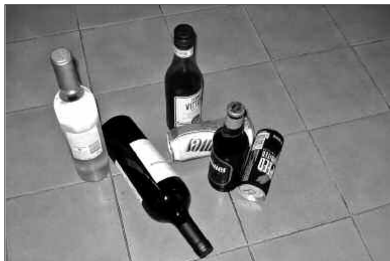
Los jóvenes no merecen agonizar tan jóvenes por causa de las drogas

Los gobiernos, las familias, las escuelas, las organizaciones religiosas, la sociedad en su conjunto, deben valorar mucho más la vida de lo que lo hacemos. Al igual que uno tiene que saber ganarse la vida y para ello se educa, también tenemos que saber caminar seriamente por los días que tengamos de vida, sobre todo desde nuestro interior, y se debe enseñar a que así se haga. Una civilización que pierde la razón de vivir, lo pierde todo. Vuelvo a repetir que me subleva los que asisten pasivos o favorecen a exhalar el último suspiro, en vez de arriar el hombro hacia los que piden asistencia para transitar por esta vida que, al fin y al cabo, es