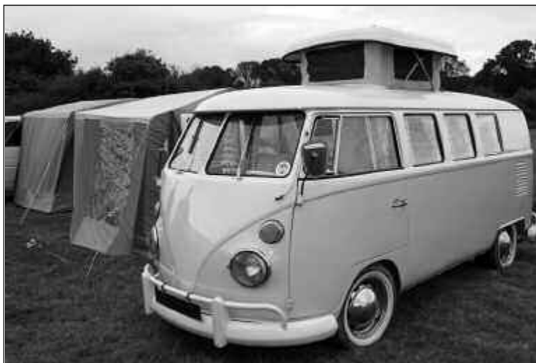
Un trámite en USA era muy sencillo en 1975 en relación a Argentina.

Sorprendidos e intrigados inquirimos a la empleada quien nos expresó que la computadora requerida había respondido "OK". La otra posible respuesta era "NO", que hubiera significado que habíamos in-