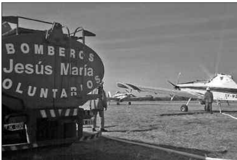
El aeródromo abasteció aviones

Al cierre de esta edición, 18 dotaciones de bomberos combatían incendios forestales en Copacabana y Villa de Las Ro-