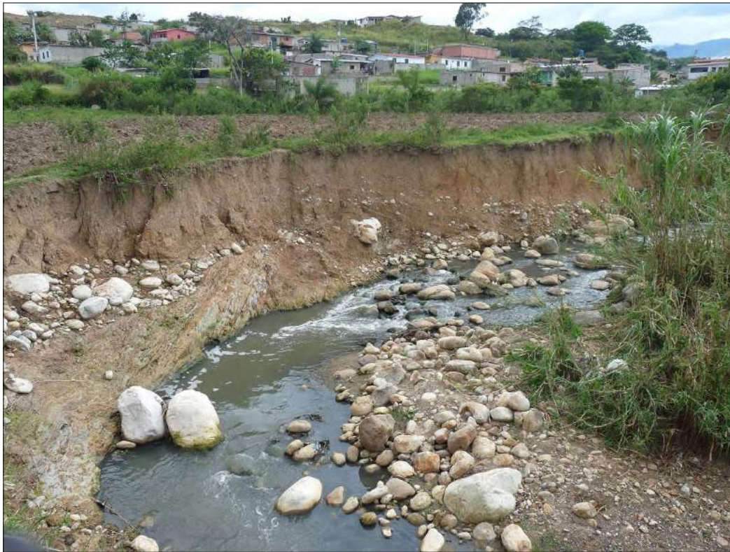
La quebrada La Yegüera pasa a menos de 100 metros de Colinas de Bello Monte.

Este cauce a lo largo de la historia ha causado tragedias en la población de Rubio, como consecuencia de las arremetidas ocasionadas por las crecidas. Una de ellas ocurrió en el año 1986