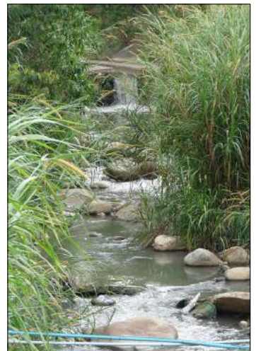
Parte donde termina el embaulamiento.

No obstante, esto parecía poco importarle a las autoridades municipales de aquella época, ya que sin acatar a las recomendaciones ambientales, a la orilla de la quebrada La Yegüera aguas arriba, en un sector especialmente agrícola