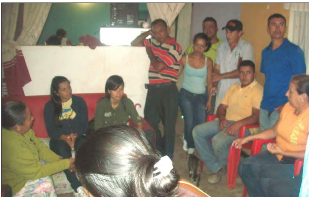
Reunión con los beneficiarios.

Hay que acotar que ya ha llegado parte de los materiales que se utilizarán para la construcción de los hogares, los cuales constan de tres habitaciones, dos baños, sala-