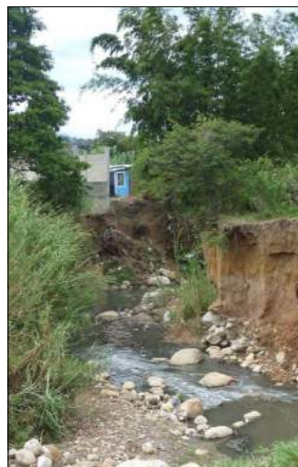
Parte afectada de Mata de Guadua.

Ya van varios años desde que realizaron el proyecto de embaulamiento de la quebrada que llegó hasta el sector Piso de Plata, y hasta estos momentos los habitantes de estos sectores continúan esperando que la Alcaldía de Junín o la Gobernación del Táchira actúen con eficacia y terminen de canalizar con cemento rígido el resto de su cauce.