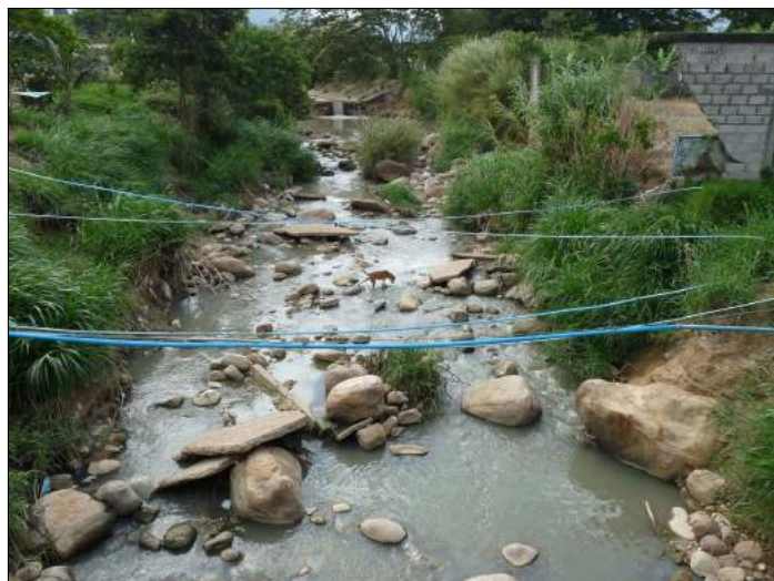
Durante una crecida de la Quebrada se llevó parte de una pared en Santa Bárbara

(conocido hoy como Cafetal y Manantial) se decide en el año 1977 la edificación de viviendas de razón social. Una construcción a la que no solamente entrarían en riegos sus beneficiarios, sino que el daño era mayor para este caudal hídrico con el lanzamiento de sus cloacas.