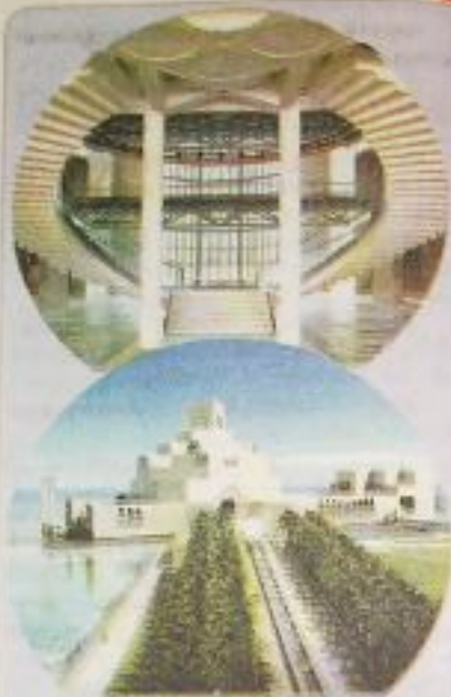
தேவசைத் தெனாப் "கோனா" சிறுக்கலாயணம்!

"ஹ பாங்க்... சரியான தேரத்துக்குத்தான் வந்திருக்க" என்று அவனுக்கும் கைதிரா பாக்கையும் காபியையும் கமலம்மா கொடுக்க,